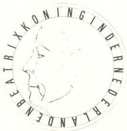
Winnend ontwerp van Ruggiu

Het idee van het project 'Munt en Beeldende Kunst' is geboren uit onvrede met bestaande muntontwerpen. Deze leverden vaak door tradities en productie-eisen be-